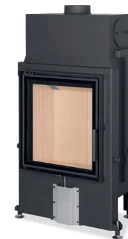
Impression 2G 55.60.01