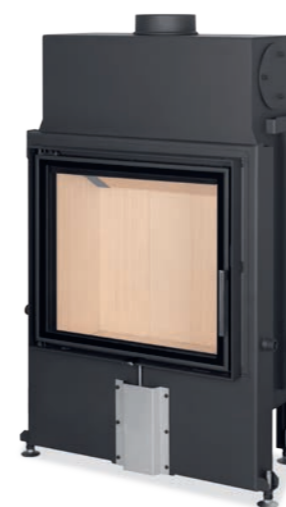
Impression 2G 67.60.01