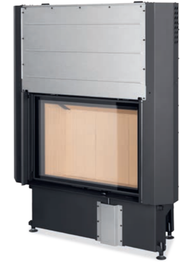
Impression 2G L 80.60.01