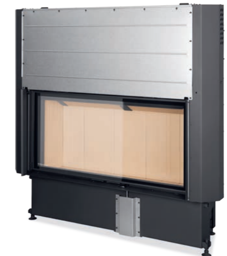
Impression 2G L 118.60.01