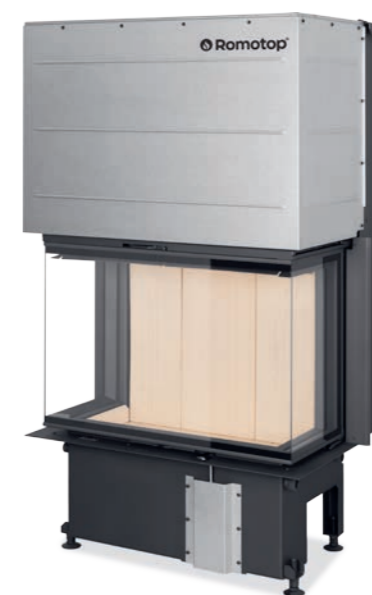
Impression C 2G L 80.61.34.21