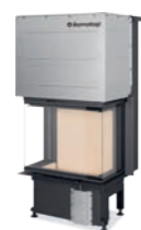
Impression C 2G L 67.61.34.21