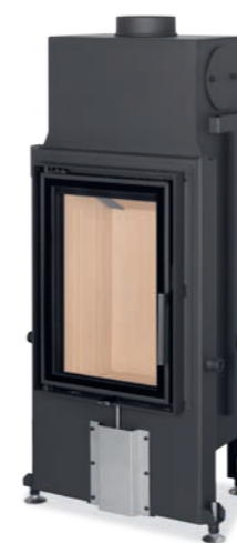
Impression 2G 42.60.01