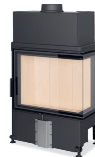
Impression R 2G S 71.60.34.21