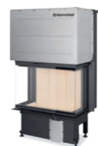
Impression C 2G L 80.61.34.21