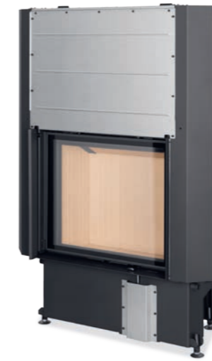
Impression 2G L 67.60.01