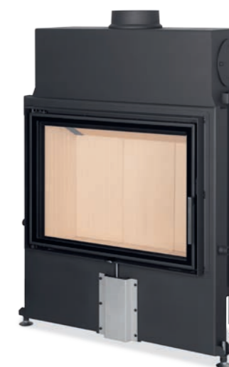
Impression 2G 80.60.01