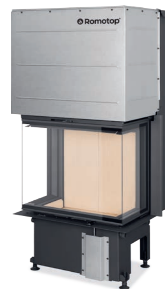
Impression C 2G L 67.61.34.21