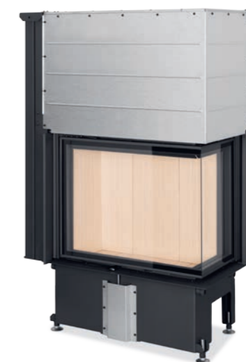
Impression R 2G L 71.60.34.21