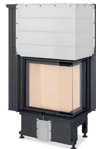
Impression R 2G L 58.60.34.21