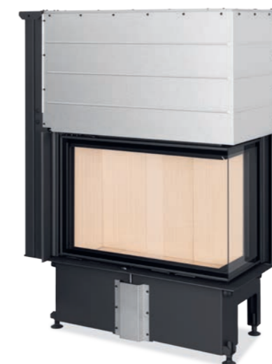
Impression R 2G L 83.60.34.21