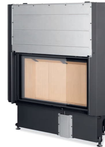
Impression 2G L 93.60.01