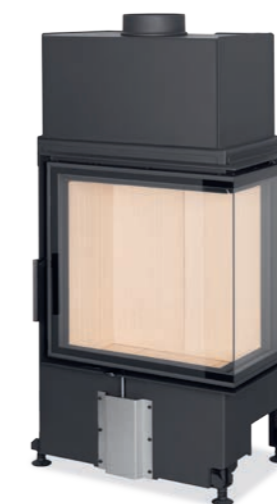
Impression R 2G S 58.60.34.21